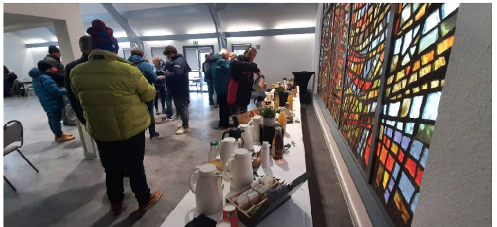
Matin, midi et soir, nous sommes gâtés avec une restauration au top. Un rapport qualité/prix imbattable.