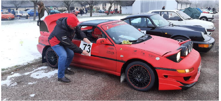
Samedi matin, après un contrôle technique particulièrement méticuleux, nous nous préparons dans le froid : - 10° au menu.